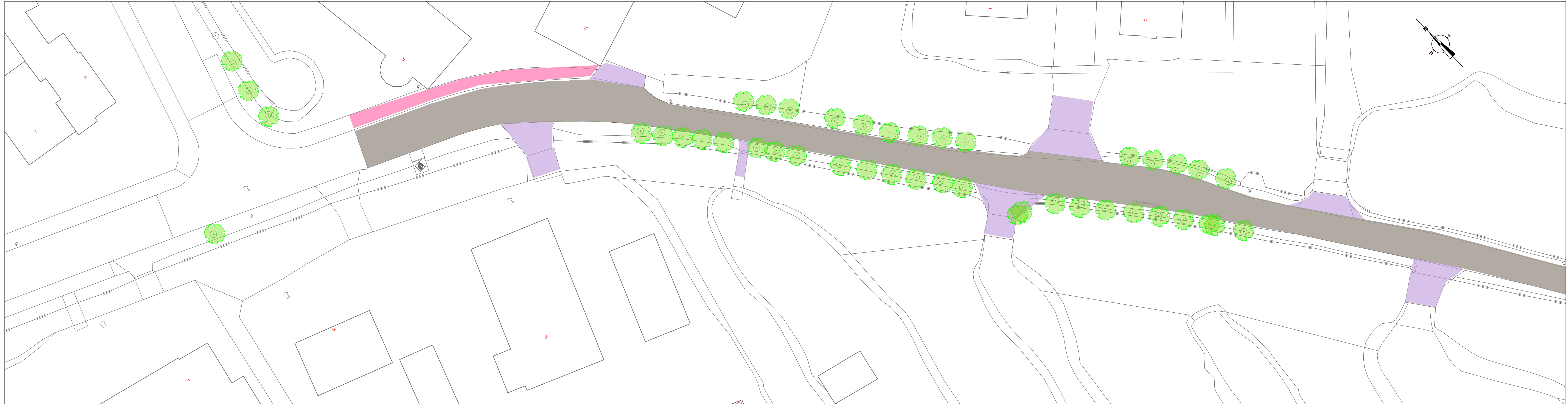
Bovenaanzicht blad 1 deel 1 Schaal 1:200