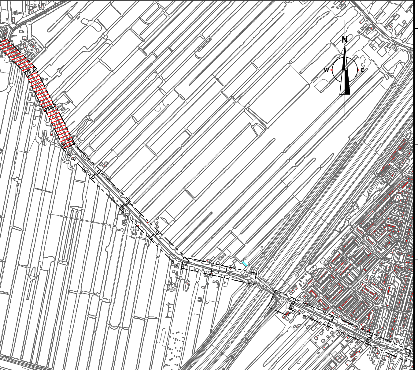
Omschrijving Schaal n.v.t.