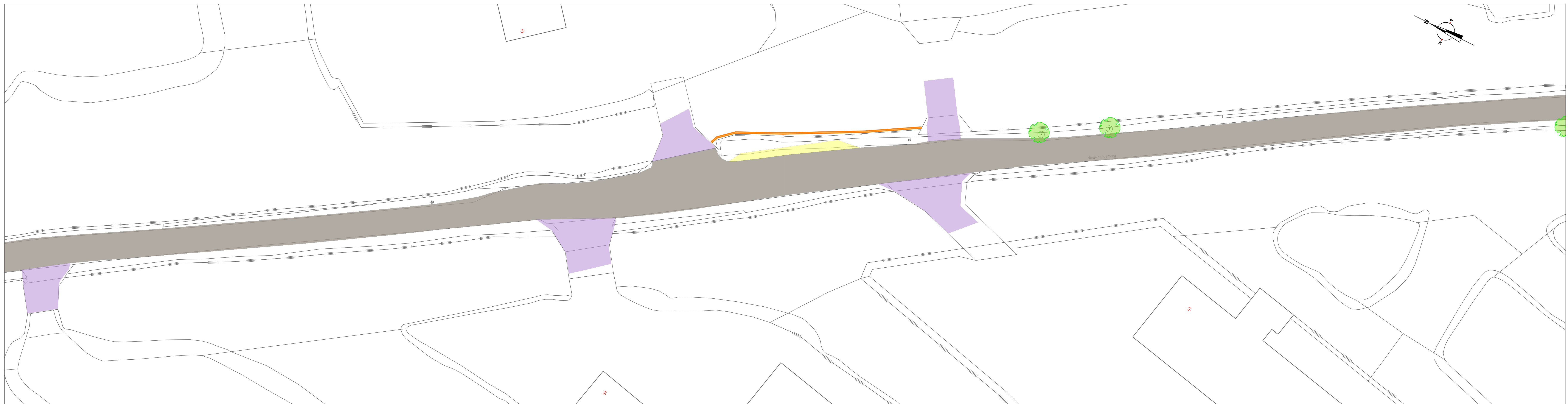
Bovenaanzicht blad 1 deel 2 Schaal 1:200