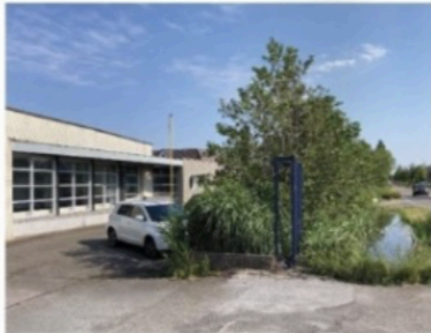
De locatie van de nieuwe dorpswinkel.

Tijdens de presentatie krijg je een stand van zaken en wordt de naam van de dorpswinkel onthuld. Mocht je 5 oktober niet kunnen, houd dan de Facebook en Instagram in de gaten.