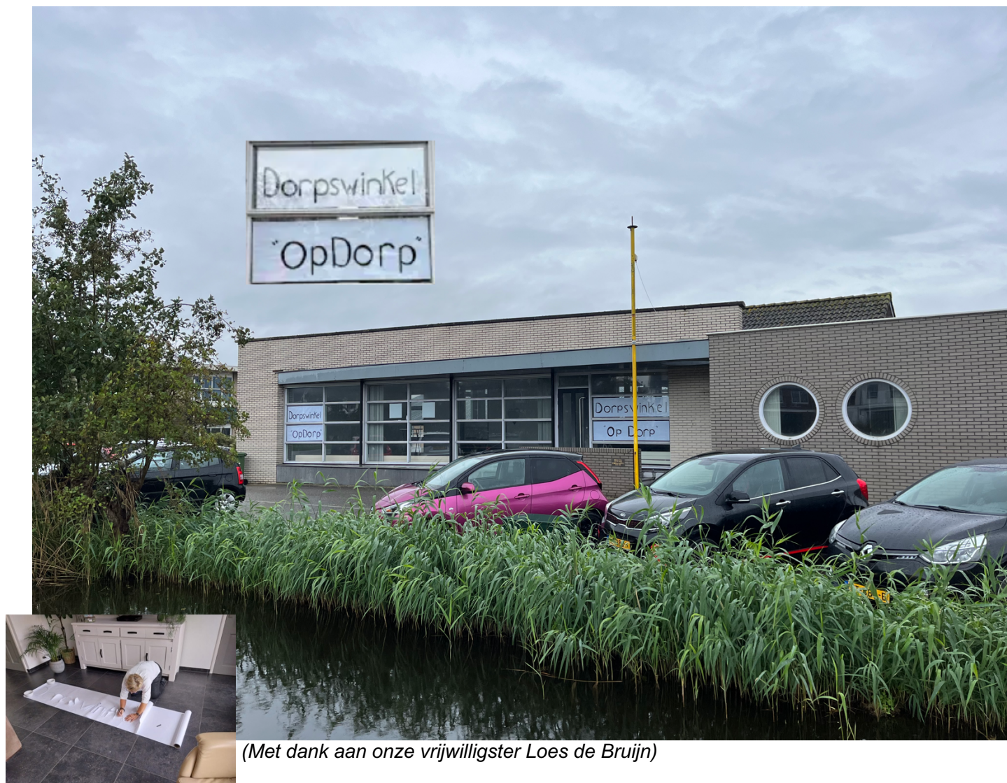
(Met dank aan onze vrijwilligster Loes de Bruijn)

. . . . ook al hebben we nog geen logo en huisstijl, we konden het niet laten om .alvast onze naam op het pand te zetten.