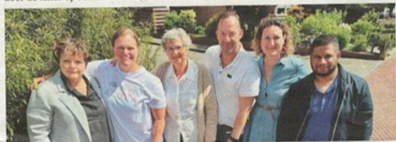
De initiatiefnemers achter de dorpswinkel.

Voor het opheffen van de onderbemaaling ten oosten van de Visschouw/Brede Schouw en ten zuiden van de Dorpsweg vindt grondtransport plaats voor het aanleggen van een waterkering. Tijdens de vergadering met de gemeente op 8 juni heeft het Dorpsteam gevraagd om de vrachtwagens in het dorp langzaam te laten rijden en liefst niet rond start- en eindtijd van de school. Het Dorpsteam heeft voor de veiligheid een verzoek gedaan om toezicht door bijvoorbeeld BOA's.