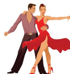
ZO DAT WAS DE ZOMER NU WORDT HET TIJD VOOR DE STOERE JAARGETIJDEN