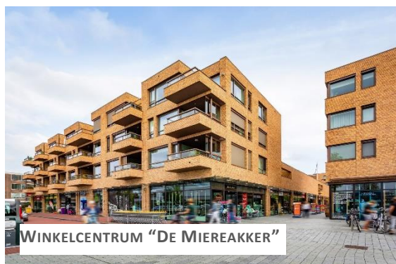
WINKELCENTRUM "DE MIERAKKER"

Medio jaren zeventig verplaatste de groei zich naar de oostkant van de Breevaart. Hier werd een tweede winkelcentrum in gebruik genomen, de "Mierakker" genoemd. Dit centrum is rond 2014 volledig vernieuwd. In beide winkelcentra kan men goed terecht voor de dagelijkse boodschappen. Daarnaast zijn er diverse overige winkels en voorzieningen. Aan het Westplein staat het dorps huis ("Huis van Alles"), rond de Mierakker vindt men het Medisch Centrum en verenigingsgebouw "De Brug".